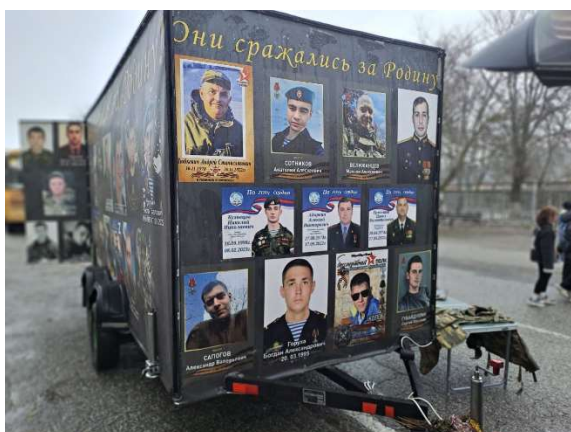
Вот именно так выглядит Фургон Памяти