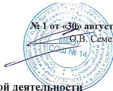
Таблица – сетка часов внеурочной деятельности для 4-х классов, реализующих ФГОС начального общего образования-2009 МБОУ СОШ № 14 на 2023-2024 учебный год